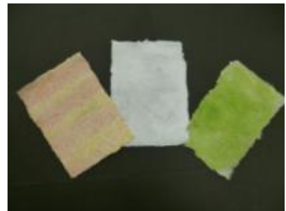
紙すきで作った紙