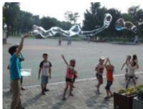
割れにくいシャボン液で作ったシャボン玉

いろいろな大きさ、形のシャボン型がセットになっています。シャボン液はセットにはついていませんが、割れにくいシャボン液の作り方などが記載された説明書がセットがついています。