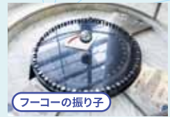
フーコーの振り子