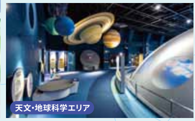
天文・地球科学エリア