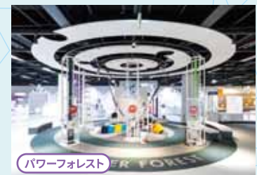
パワーフォレスト