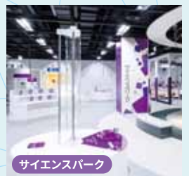
サイエンスパーク