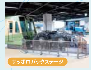
サッポロバックステージ