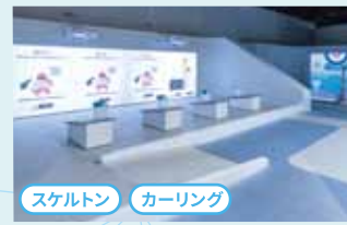
スケルトン カーリング