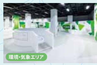
環境・気象エリア