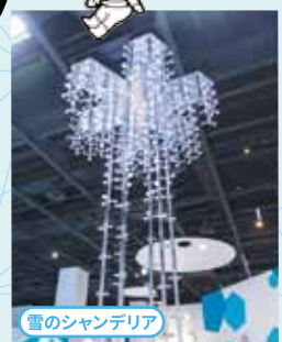
雪のシャンデリア