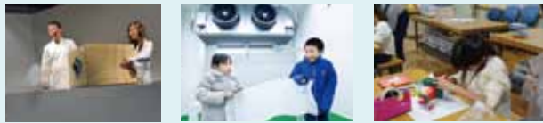
●サイエンスショー ●低温プレイグラウンド ●工作室