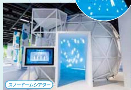
スノードームシアター