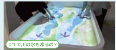
0°Cで川の水も凍るの?