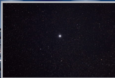
天津四(天鹅座主星)