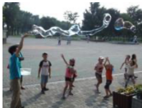
割れにくいシャボン液で作ったシャボン玉

いろいろな大きさ、形のシャボン型がセットになっています。シャボン液はセットにはついていませんが、割れにくいシャボン液の作り方などが記載された説明書がセットがついています。