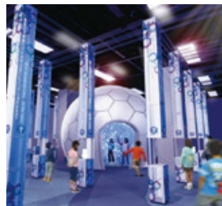
スノードームシアターイメージ

もちろんプラネタリウムも今までどおり、美しい星空をお届けしていきます。新しくなった科学館をぜひ満喫してくださいね!