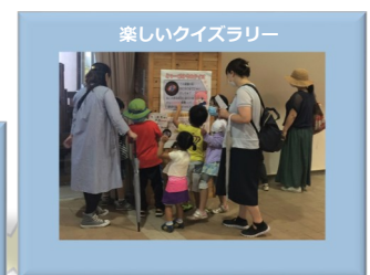
楽しいクイズラリー